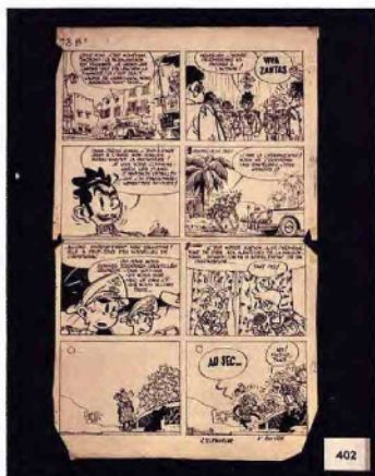
Une planche du « Dictateur et le champignon »: publiée dans le journal Spirou n°828 du 25 février 1954. L'album est publié en 1956 aux Éditions Dupuis. Adjugée à 50.000 €.

Fondée en 2005 par Arnaud de Partz sous le nom de Banque Dessinée, la maison bruxelloise de ventes aux enchères s'est d'abord consacrée entièrement au vaste univers de la bande dessinée. Cette spécialisation exclusive, maintenue jusqu'en 2016, lui a permis de devenir l'un des leaders européens dans ce domaine si particulier du 9 e art. Albums, planches et dessins originaux, produits dérivés, sérigraphies, cartes de vœux, dédicaces, tirages de tête ou encore porrfolios, tout cela n'a plus aucun secret pour les experts de la maison. En 2017, la société connaît une évolution majeure en adoptant le nom de Millon Belgique, suite à l'entrée de la maison parisienne dans le capital. Cette période va marquer une diversification ambitieuse avec le développement de nouveaux départements: Joaillerie et Horlogerie, Tableaux et Objets d'Art , tous gérés depuis les locaux bruxellois.