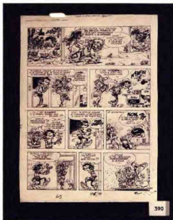
La fameuse planche de Gaston qui a explosé les estimations avec une adjudication à 160.000 €, hors frais.

La récente vente cataloguée de bandes dessinées, qui s'est tenue chez AZ Auction le 7 juin dernier, a dépassé toutes les prévisions. 93,5% des lots ont été vendus pour un total de 671.000 €, bien au-delà de l'estimation initiale de 400.000 €. La palme revient assurément au lot 390, une planche-gag de Gaston, le célèbre héros de papier d'André Franquin. Le lot a été adjugé à 160.000 € (hors frais), pulvérisant l'estimation fixée à 40.000 - 50.000 €.